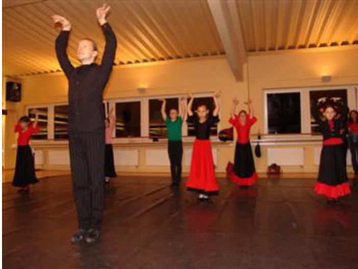
Die stolze Körperhaltung gehört beim Flamenco dazu.